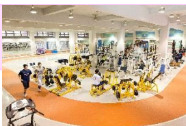
トレーニングセンター