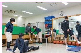
アスレティックトレーニングルーム