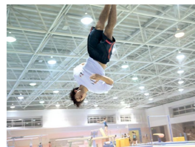
美しい空中姿勢が南選手の武器