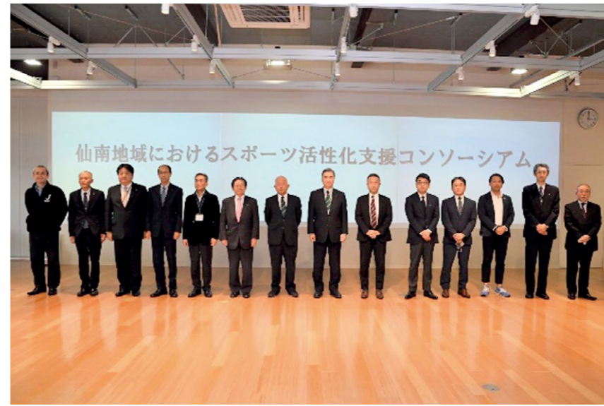
コンソーシアム発足総会に参加した自治体や企業、協会等の代表者による記念撮影

本コンソーシアムは、本学が持つさまざまな資源を活用し仙南地域におけるスポーツの普及推進を図るとともに、地域の健康・スポーツ等に関する課題について議論し、産学官が協力して解決方策の検討を通じ地域活性化に寄与することを趣旨として設立されました。