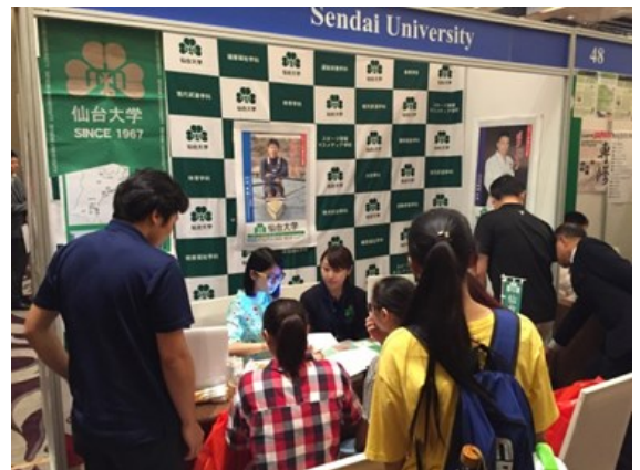
会場内に設置された本学のブース