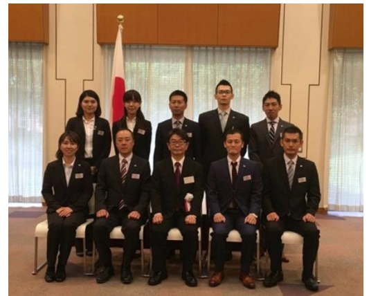
英国派遣団 ※前段中央は内閣府国際交流室長

英国でもゆるやかに高齢化が進行しており、高齢者の孤立や認知症患者の増加等、日本と同じ問題も抱えています。また、高齢者がいつまでも健康に過ごせるよう、介護予防の取組も重要視されました。世界的にも“高齢者の健康づくり”は重要な視点であり、これまで本学が取組んできた地域を巻き込んだ高齢者の健康づくりは非常に重要です。今後も地域に根差しながら更に発展させ、世界にも発信できるよう活動していこうと決意した研修となりました。