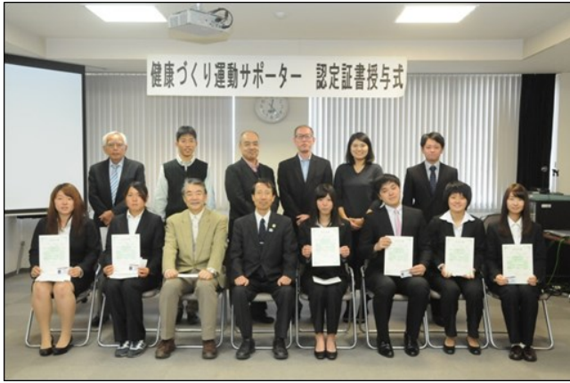
認定証授与式後の記念撮影

10月25日（火）に健康づくり運動サポーター（以下、健サポ）の認定証書授与式を開催しました。今回は平成28年度前期の資格認定評価会で認定された初級6名に対して、認定証書が授与されました。健サポは本学独自の認定資格であり、これまで延べ474名が本資格を取得しています。