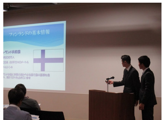
フィンランドでの留学の様子を報告する学生

会場には30名を超える教職員のほか、今後留学を考えている学生の姿も見られ、報告者へ質問をするなど活発な報告会となりました。