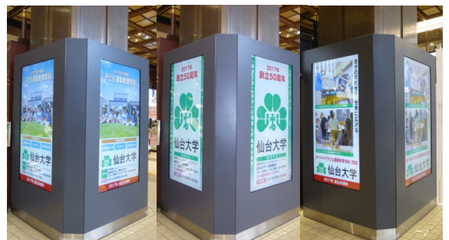
リニューアルされた3種類の広告看板

掲出期間は10月11日～来年3月31日までの半年間です。仙台駅をご利用の際には是非ご覧ください。