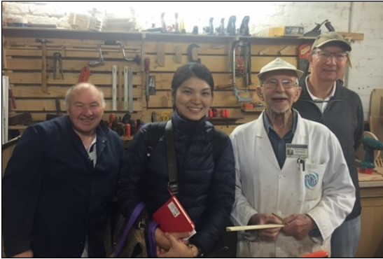
高齢者が集う作業所で現地の高齢者と

内閣府では、国際交流事業の一環として、地域課題対応人材育成事業「地域コアリーダープログラム」を実施しています。この事業は、日本の各地で高齢者関連、障害者関連及び青少年関連の課題解決に向けた取組に携わる日本青年を先進事例のある外国への派遣、外国において同様の課題解決に取り組む青年の招へいを行い、地域において国際的視野をもち、地域の活性化に貢献できる人材を育成することを目的としています。私は今回、高齢者分野の英国派遣団として派遣されました。