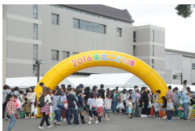
過去最大の19,100人が来場