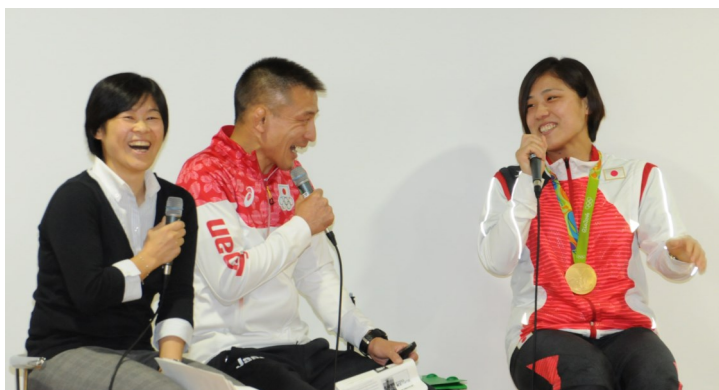
リオ五輪柔道女子70kg級金メダリスト田知本選手（右）

10月9日（日）・10日（月・祝）の2日間、柴田町制施行60周年記念「2016東北こども博」（主催：東北こども博実行委員会、後援：文部科学省／宮城県など）が本学を会場として開催され、過去最高の約19,100人（昨年は17,700人）の方々がお来場下さいました。