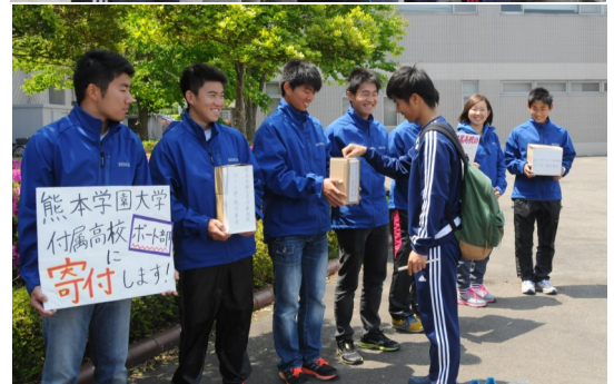
学内で募金活動を行う男子サッカー部員（上）と漕艇部員