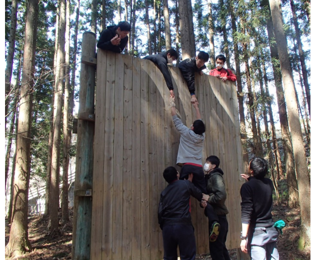
ASEトレーニングを行う男子バレーボール部員