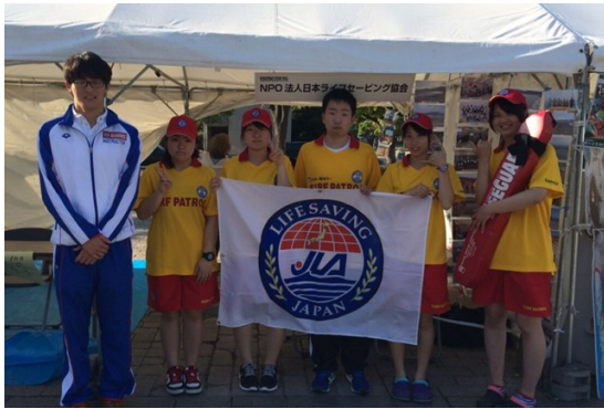
気仙沼ライフセービングクラブの方々とともに

5月28日（土）～29日（日）仙台市役所前市民広場で行われた、平成28年度ボーイスカウト全国大会「スカウティングエキスポ」において、気仙沼ライフセービングクラブとの共同で仙台大学ライフセービング同好会の3名が日本ライフセービング協会のブースを担当し「水の安全」と「人命救助」について展示・実演しました。