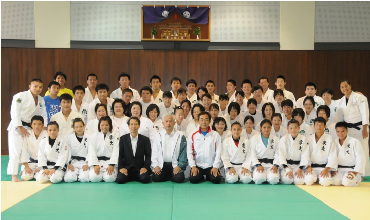
仙台大学柔道部と台東大学柔道部との記念撮影＝仙台大学柔道場

9月9日（月）～9月13日（金）までの5日間、仙台大学柔道場で仙台大学と台湾・台東大学との「柔道合同練習会」が実施されました。