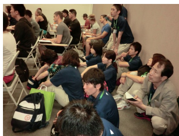
大学院の授業を聴講