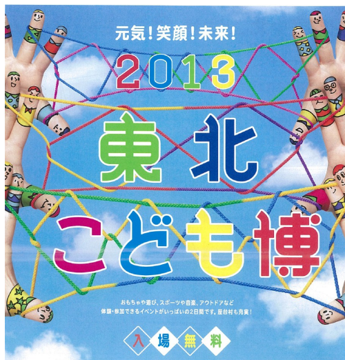
2013東北こども博のポスター

仙台大学・一般社団法人日本玩具協会、柴田町等で構成される東北こども博実行委員会は、来たる10月12日(土)・13日(日)の二日間、仙台大学キャンパスにおいて「2013東北こども博」を開催致します。