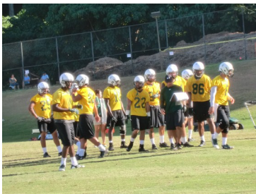
フットボール公式試合に向けて早朝から練習に励むUHの学生たち