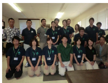
ATワークショップを終えて

平成25年8月25日から9月1日にかけて、ハワイ州立大学アスレティックトレーニング研修アドバンスコースが実施された。この研修（ビギナー・アドバンス合わせて17回目）には2～4年生の体育学科11名の学生が参加した。このアドバンスコースの主な目的は、アスレティックトレーニングにおける最先端の情報や技術を見学・体験することにある。また、現地の人々と触れ合いながら、その文化と習慣を体感できることもこの研修の良さと言える。