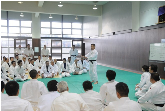
指導者養成講習会の様子