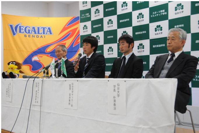
共同記者会見の様子